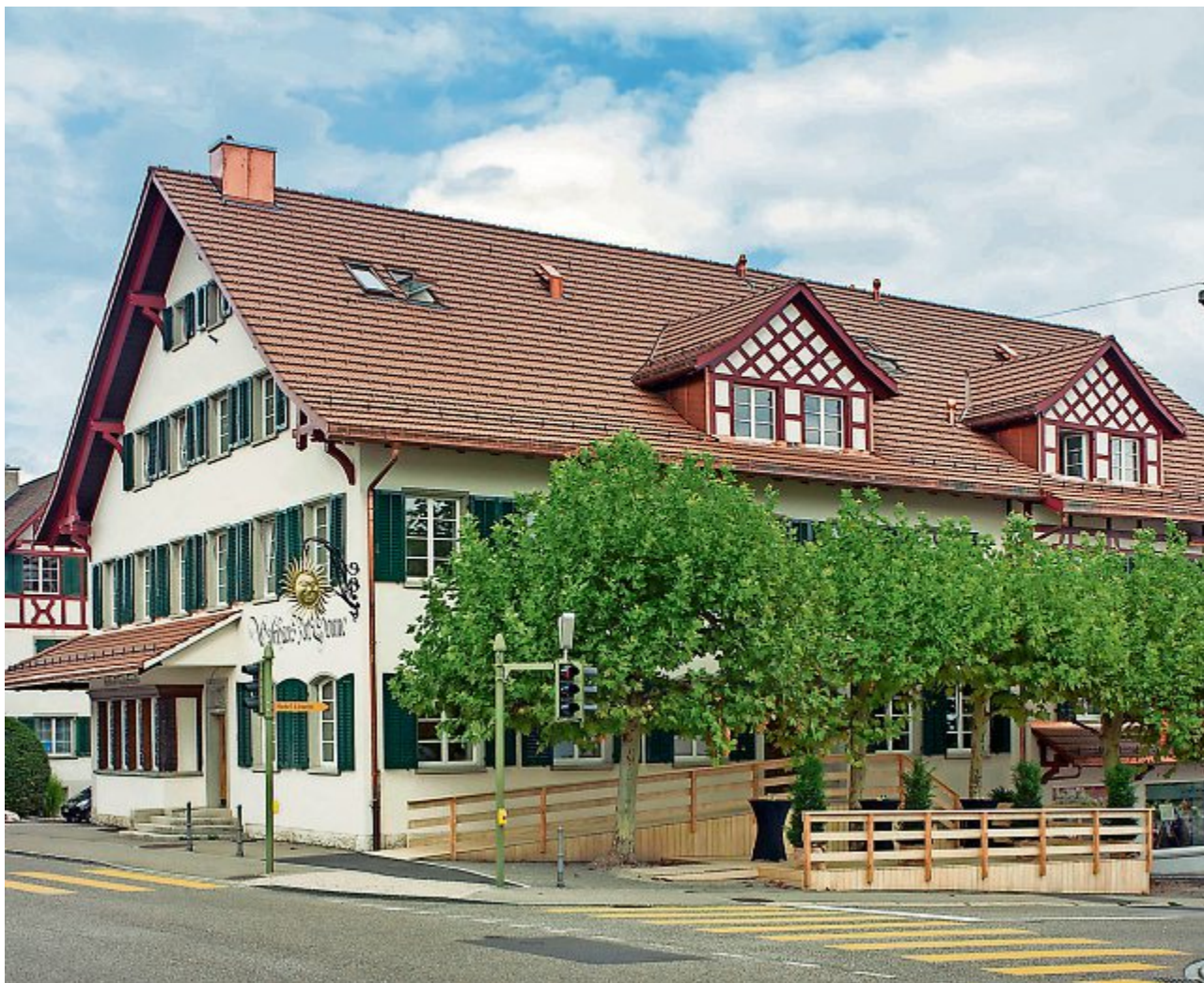
Das Restaurant Sonne wird wiedereröffnet.