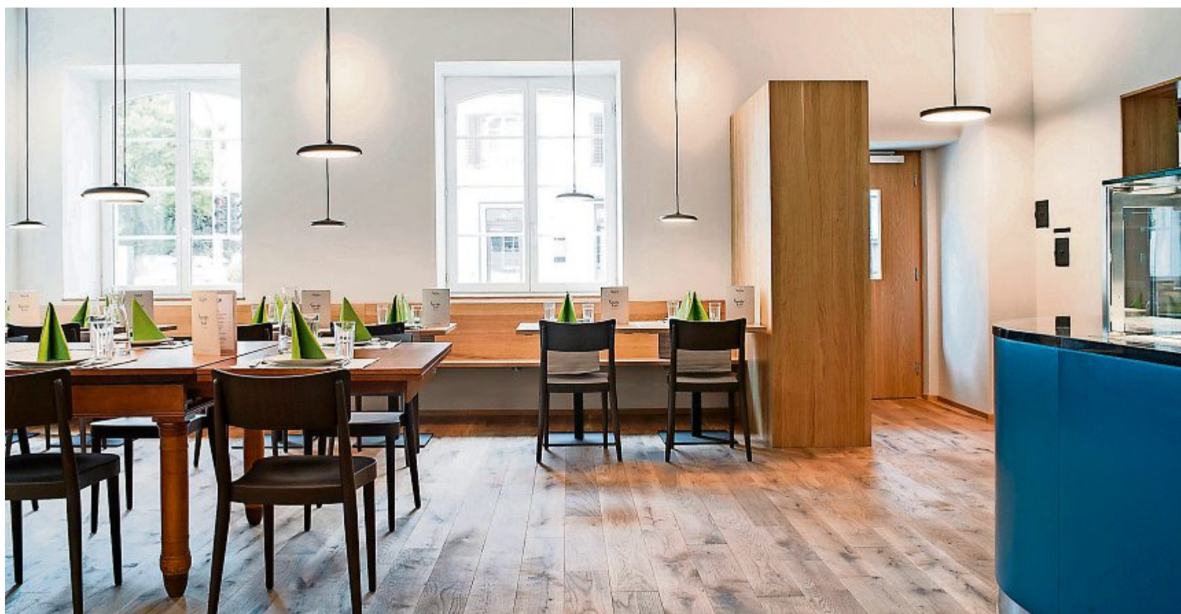
Blick ins geschmackvoll renovierte Restaurant Sonne.

Während im Restaurant 28 Gäste Platz finden, bietet das gemütliche Stübli mit dem denkmalgeschützten Kachelofen sowie der Originalstukturdecke weitere 16 Plätze. Die «Atrinkete» findet am Mittwoch, 26. September, ab 17 Uhr statt, ab Donnerstag, 27. September, ist die «Sonne» dann offiziell in Betrieb. Das Restaurant hat wie folgt geöffnet: Montag bis Freitag, 11-18 Uhr, zusätzlich ist am Donnerstagabend bis 22 Uhr geöffnet. Zusätzliche Öff-