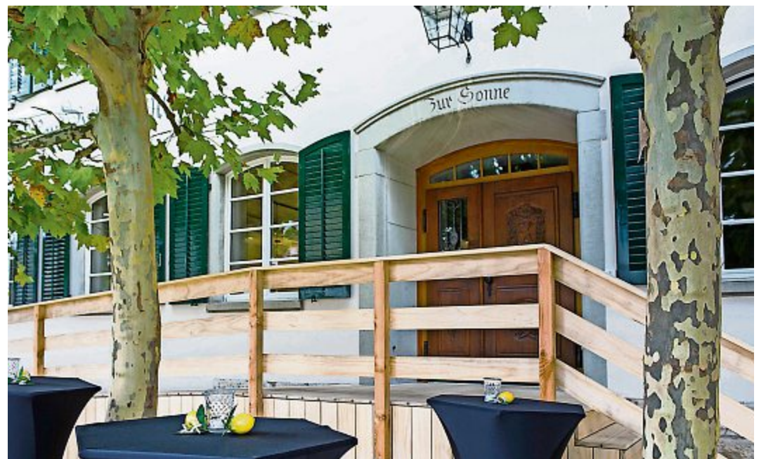
Schon bald öffnet sich die Türe zum Restaurant Sonne wieder.

Badenerstrasse 20, 8107 Buchs, Tel. 044 844 01 51, www.langmeier-ag.ch