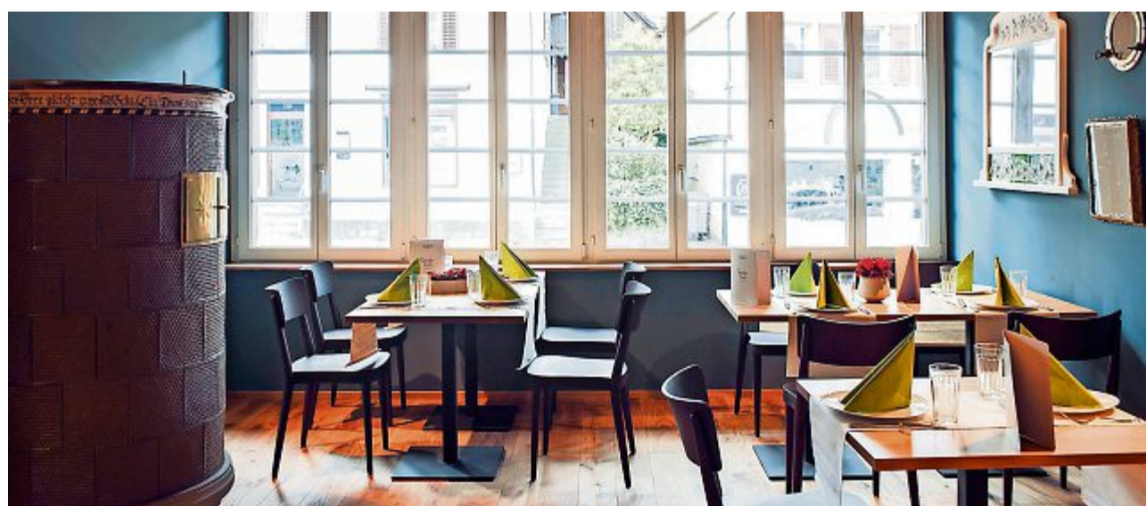
Gemütliche Atmosphäre im denkmalgeschützten «Stübli».

Tobelstrasse 11, 8345 Adetswil, Telefon 044 938 00 00, Fax 044 938 39 30 Postadresse: Postfach 382, 8344 Bäretswil